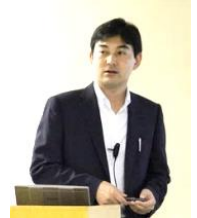
(株)いがた事業承継サポート室 代表取締役 事業承継士・中小企業診断士