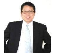
取締役 事業承継士・中小企業診断士